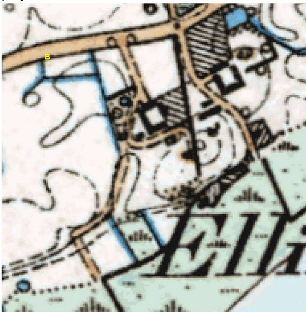
Høje målebordsblade 1842-1899

På kortet fra 1800-tallet kan man se, at der syd for landevejen løb en blanding af åbne og rørlagte grøfter ned til fjorden. Punkt B på kortudsnittet svarer ca. til brønd B i det ansøgte projekt.